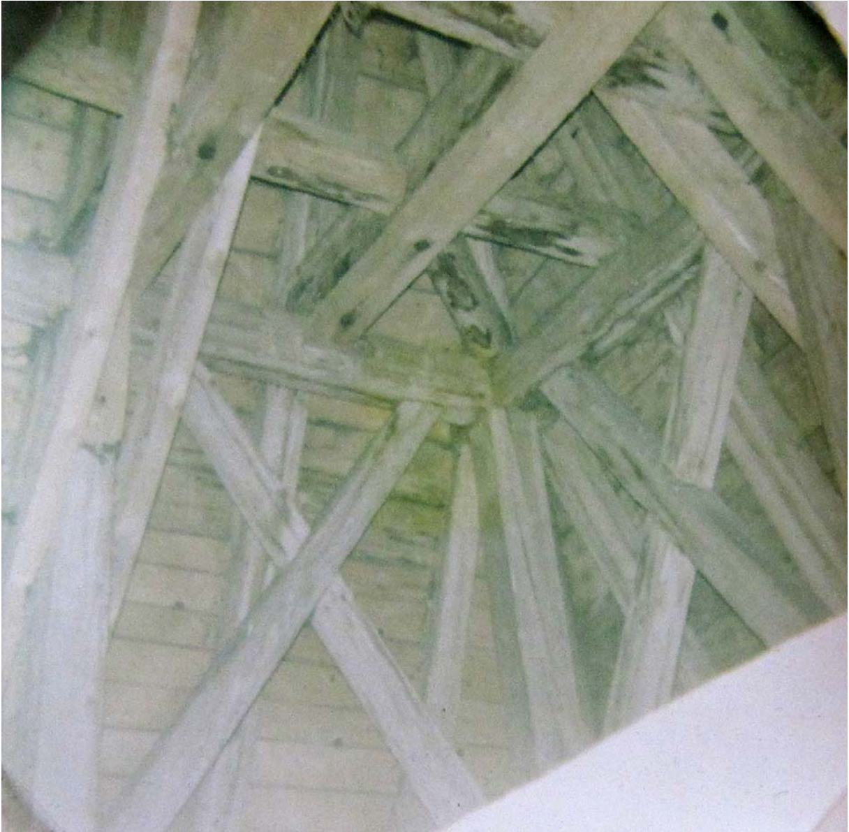
Charpente de la tour