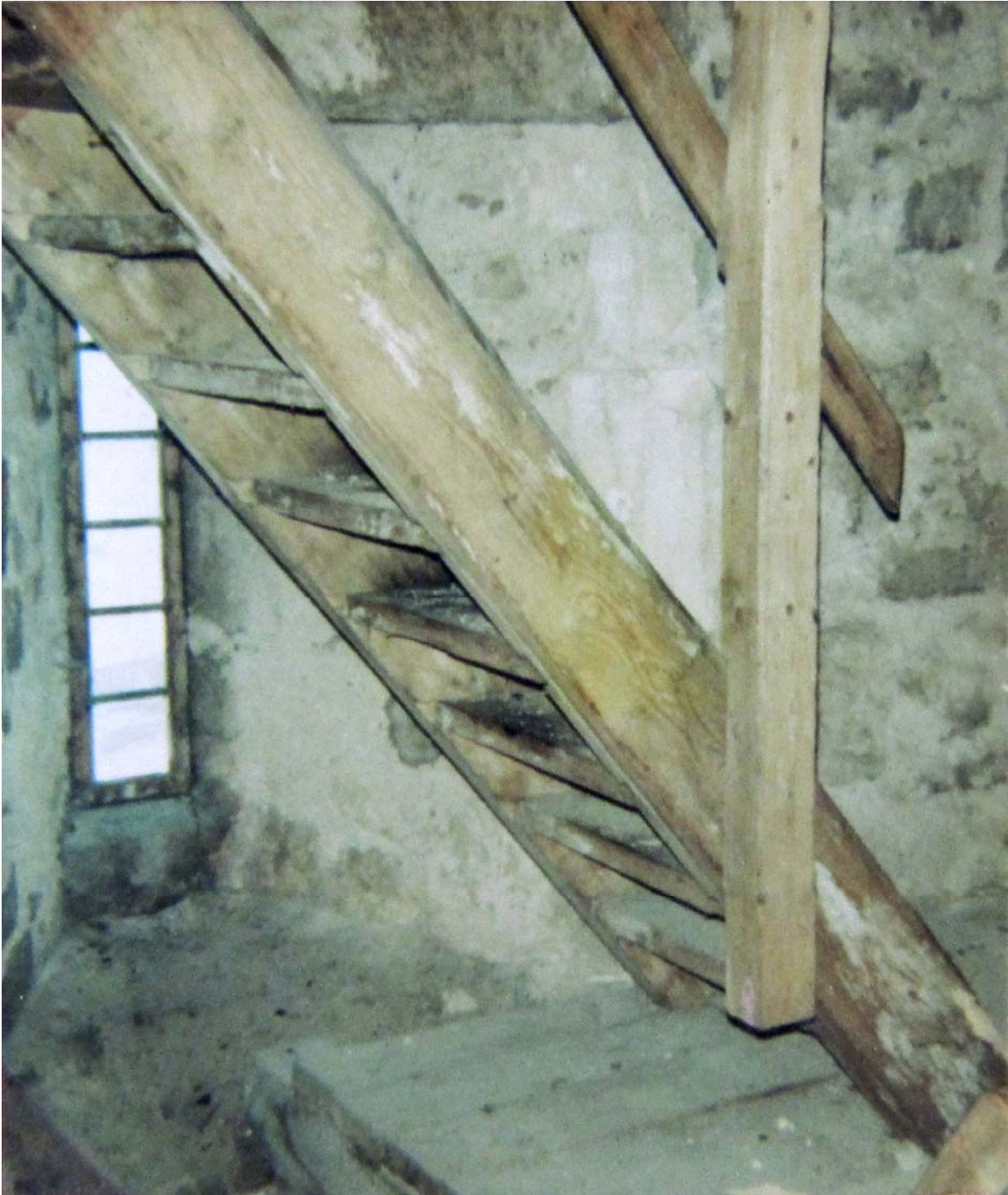
Escalier pour monter dans la tour