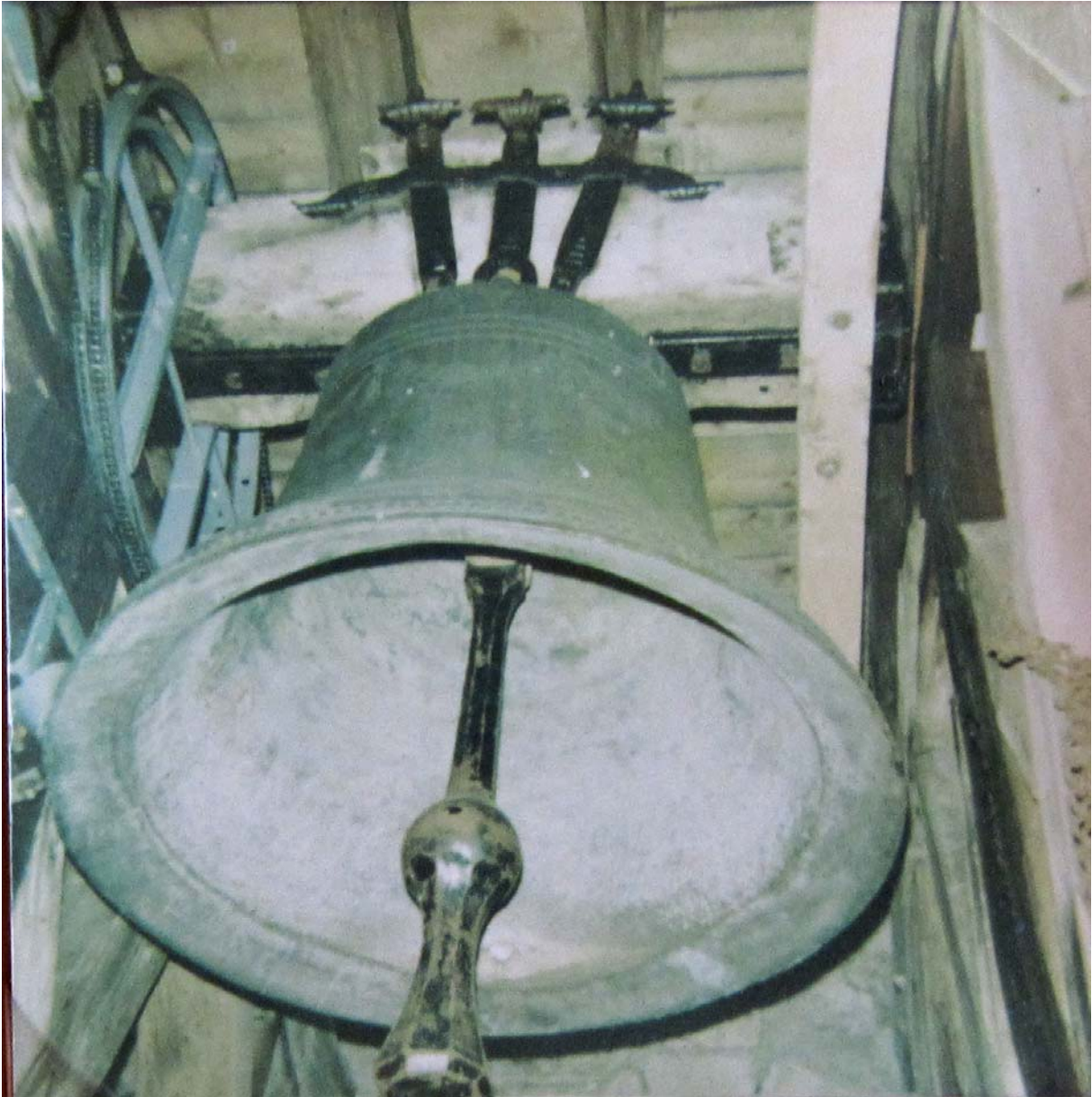
Une des trois cloches