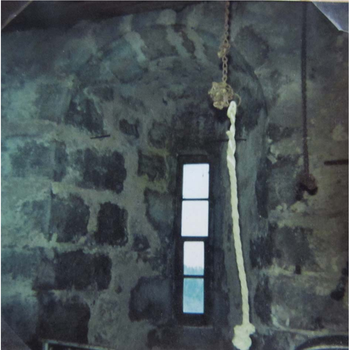
Une fenêtre de la tour et la corde pour sonner les cloches, ou tout au moins l'une d'entre elles